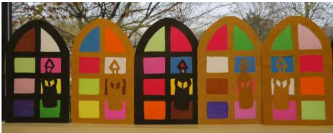
Unser Schulpatron Albertus Magnus Fensterbilder, gebastelt am Albertus-Magnus-Tag der 5. Klassen

Das Team der Schulseelsorge wünscht allen ein gesegnetes Weihnachtsfest und ein glückliches und friedliches neues Jahr!