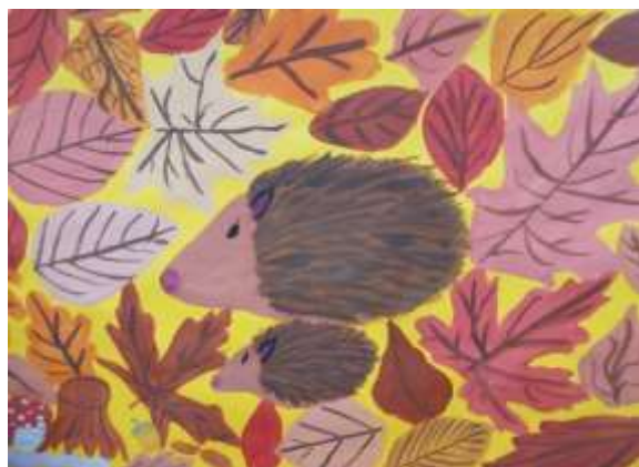
„Igel im Herbstlaub“ – 5b und 5d (Schuljahr 2023/24) – Farbfamilien, warme Farben (diese und vorausgegangene Seite)