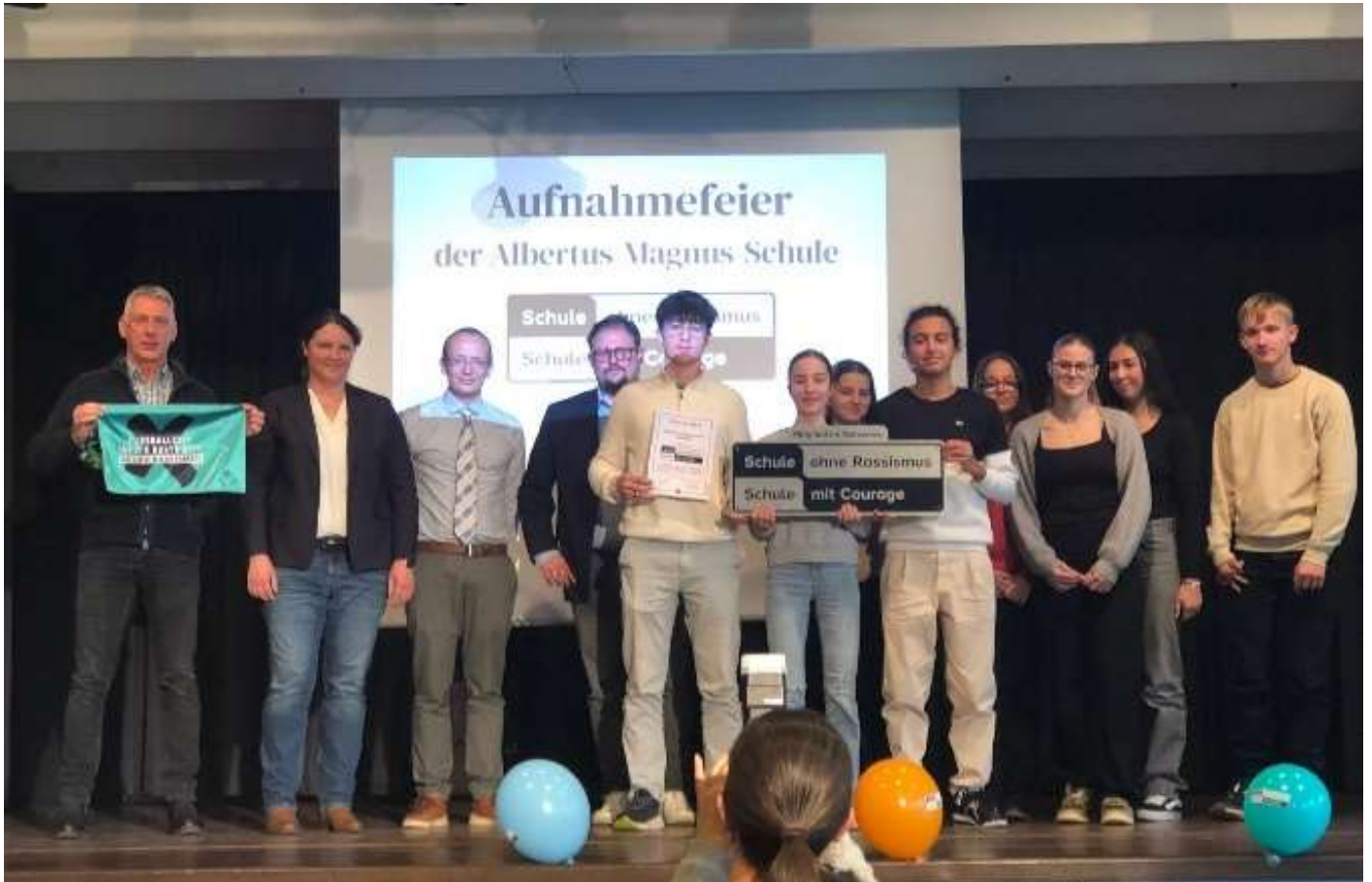
Feierliche Übergabe der Aufnahmeurkunde

und Projekte zur Stärkung von Toleranz und Akzeptanz.